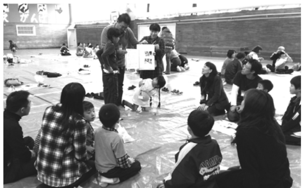
▲グループ毎に家庭学習レポート発表

我々の活動により、函館地区の市民に喜んでいただけるよう、会員全員楽しく、無理せず和気あいあい、続けていこうと考えております。そして子供たちがこの函館地区をより、好きになってくれることになれば本望です。