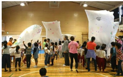
◀ 10/29 星川小での「宇宙の教室」みんなで熱気球を揚げました。