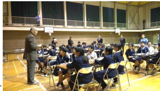
▶ 10/26 本郷小での三菱重工の理科授業 スポイトロケットを飛ばして、ロケットが飛ぶ原理を学びました。