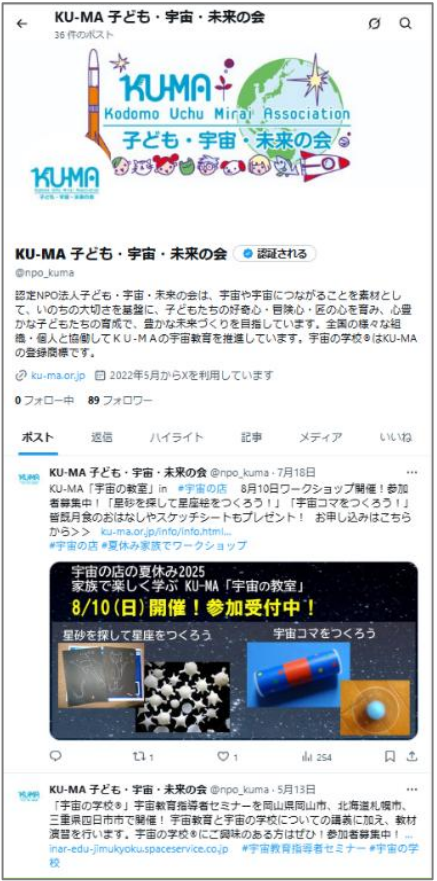
▲KU-MA の X アカウントです フォローをお願いいたします。