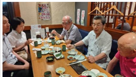
▲総会終了後、会員の方と事務局でささやかではございますが、懇親会を開きました。

・クラウドファンディングの活用について、クラウドファンディングにはファンのような人たちがいて、寄付先を探していたり、大学や企業が資金獲得の実績として利用していたり、様々なアプローチ方法がある。分野に特化したクラウドファンディングもあるのか...色々検討してみてもいいかな...この他にも貴重なご意見をいただきました。今後の活動の参考とさせていただきます。