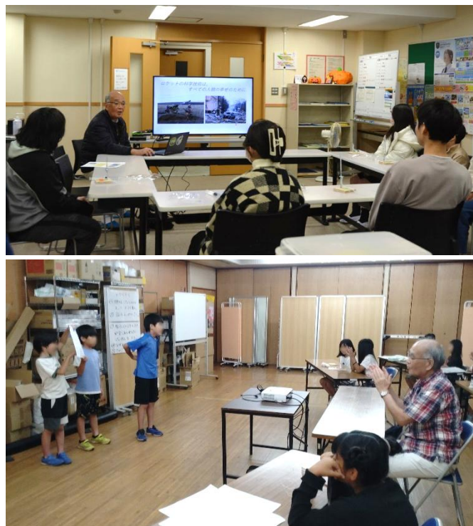
▲昨年度(2024 年度)開催模様